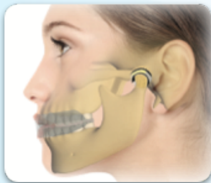
Takojšnja diagnoza in zdravljenje TMJ motnje.