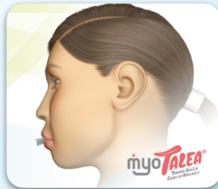
MRC-jev program aktivnosti za vse starostne skupine.